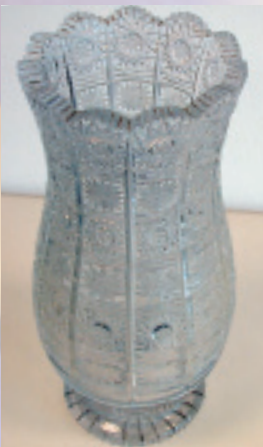
Kristallen vaas uit Slowakije

Het vaaswater schoon en helder houden is een eerste vereiste. In vaaswater van enkel leidingwater is de vervuiling niet te voorkomen, met als gevolg vuile randen. De voedingssupplementen en de zuurregelaars in Chrysals snijbloemenvoedsels herstellen het evenwicht in de bloem en brengen de weerstand tegen cel- en steelafbraak weer terug op het natuurlijke niveau zoals aan de plant. De versnelde veroudering door het afsnijden wordt hierdoor vertraagd. De bloem ontwikkelt zich verder op natuurlijke plantintacte wijze en het vaaswater wordt niet extra belast door alle afbraakproducten van de steel