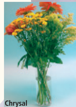
Chrysal Precies goed