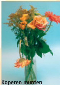
Koperen munten Geen effect