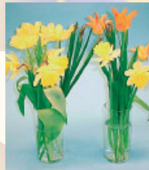
Gemengd boeket met Narcissus en Tulipa in vaaswater met Chrysal Narcis