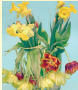
Gemengd boeket met Narcissus en Tulipa in alleen leidingwater

Snijd eerst een steelstuk van de andere bloemen af en daarna pas van de Narcissus, zodat geen slijm via het mes op de snijvlakken van de andere bloemen wordt overgebracht.